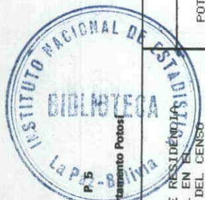
CUADRO P. 5 POBLACION DE 5 Y MAS AÑOS, POR LUGAR DE RESIDENCIA HABITUAL EN EL MOMENTO DEL CENSO SEGUN LUGAR DE RESIDENCIA HABITUAL EN SEPTIEMBRE DE 1971